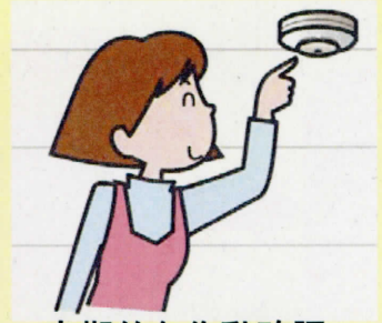
定期的な作動確認

作動確認をしても警報器に反応がなければ、本体の故障か電池切れです。警報器本体を交換しましょう。（※2）