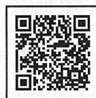
違反対象物公表制度